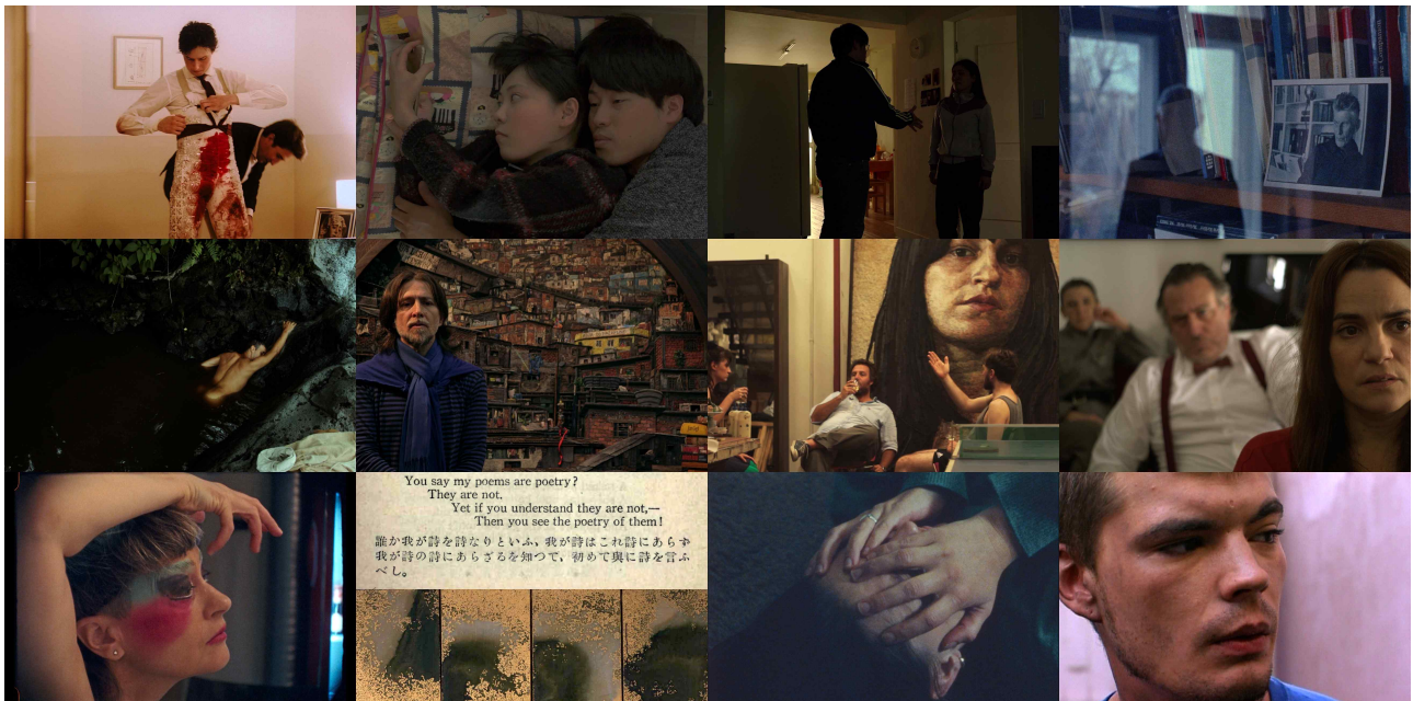
특별전: 가능한 영화를 향하여 스틸 (알파벳 순)

26회 전주국제영화제(공동집행위원장 민성욱·정준호)가 특별전 '가능한 영화를 향하여'를 통해 영화제작과 미학에서 자신만의 대안을 찾은 9팀(트래비스 월커슨, 안데르그라운필름, 데클런 클라크, 마리 로지에, 니콜라스 페레다, 엘팜페로시네, 사랑하자, 테드 펜트, 라두 주데)의 제작사와 창작자를 소개한다. 영화영상산업이 점점 거대해지는 구조에 저항하며 작은 자원이지만 많은 아이디어와 창의력으로 다른 영화를 할 수 있는 가능성을 제시하는 영화들이 관객과 만날 예정이다.